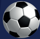
Balón de Fútbol