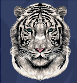
Tigre Siberiano Blanco